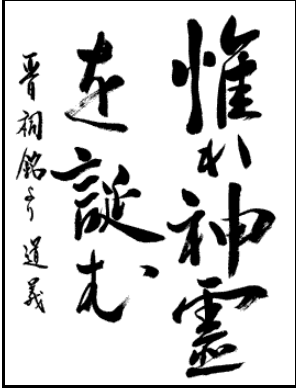
古屋 道義 (詩文書)